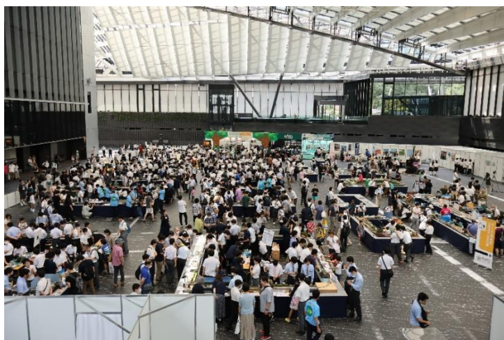
賑わう会場の様子

戸山高校地理歴史部は8/4（金）～8/6（日）に新宿住友ビル三角広場にて行われた全国高等学校鉄道模型コンテスト2023、モジュール部門に出場しました。私たちは神奈川県川崎市にある京急線、旧産業道路駅を再現しました。部員1人1人が手作りで丁寧にジオラマを制作し、ベストクリエイティブ賞、ベストライター賞を受賞しました。作品は戸山祭にて展示する予定です。ぜひお越しください。